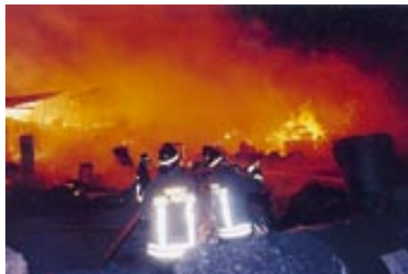
Operazione di estinzione incendio in una fabbrica

lavorare congiuntamente ai professionisti anche se in molte aree è più facile vedere impegnate solo squadre di vigili del fuoco volontari che operano in qualsiasi tipo di intervento; l'esperienza accumulatasi negli anni e la cultura pompieristica tramandata di generazione in generazione permette loro di portare soccorso a persone, animali e cose nelle calamità, negli incidenti stradali e ferroviari, in tutti i tipi di incendi, nelle alluvioni, nelle frane, ecc. L'esperienza maturata in Albania nel 1999, a sostegno della popolazione del Kosovo martoriata dalla guerra con i serbi, ha dimostrato che i vigili volontari sono addestrati ad operare proficuamente in condizioni difficili anche a migliaia di chilometri dalle loro sedi. In un'Italia con industrie a rischio, dai grossi centri abitati, dal cospicuo patrimonio boschivo, dalle centinaia di paesi sperduti in montagna, dalle aree a rischio sismico e vulcanico oltre che nei circa