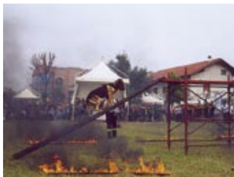
Un ritorno al passato con l'utilizzo di una pompa manuale

La presentazione della domanda di arruolamento è seguita da una visita medica preliminare da effettuarsi presso il Comando provinciale ed una successiva, più accurata, presso una struttura convenzionata (Es. Ferrovie dello Stato, ASL, ecc.).