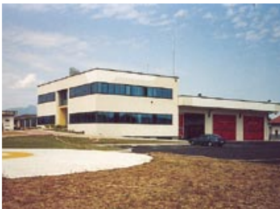
Distaccamento VVF Volontari di Palazzolo/O (BS)

per l'acquisizione di materiali, mezzi ed attrezzature da trasferire, in comodato gratuito, per le necessità dei distaccamenti volontari indicati nelle convenzioni stesse; gli Enti locali possono ritornare in possesso dei beni prestati al termine del periodo indicato nella convenzione o all'eventuale cessazione dell'attività del Distaccamento volontario. Non è da trascurare la possibilità di consorziarsi con i comuni vicini per una compartecipazione nei costi necessari al mantenimento in servizio attivo della sede volontaria.