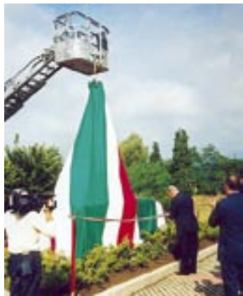
Inaugurazione monumento ai VVF Cantù - Como