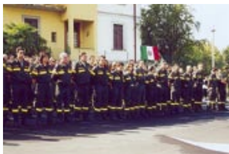
Vigili del Fuoco Volontari in riga in occasione di una manifestazione

L'attività di un vigile del fuoco volontario non si esaurisce con gli interventi di pronto soccorso, bensì prosegue con la prevenzione e l'istruzione rivolta alla cittadinanza (es. iniziative rivolte agli allievi ed insegnanti degli istituti scolastici), la collaborazione nelle locali manifestazioni, la partecipazione a riunioni, commemorazioni e cerimonie, il mantenimento delle pubbliche relazioni con enti pubblici e privati per il reperimento di fondi atti all'acquisto di nuovi automezzi ed attrezzature. I vigili del fuoco volontari inoltre provvedono a mantenere in buono stato la propria sede di servizio ed effettuano l'ordinaria manutenzione degli automezzi e delle attrezzature oltre agli addestramenti professionali, obbligatori per legge.