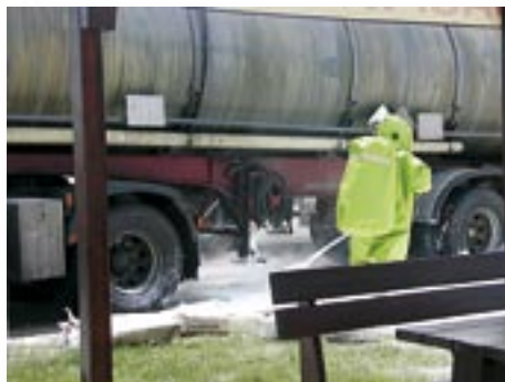
Intervento di un operatore NBCR su sostanza pericolosa

Nelle decine di migliaia di interventi che i volontari effettuano ogni anno, non è difficile trovarli a