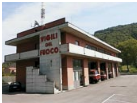
Distaccamento VVF Volontari di Gazzaniga (BG)

Il progetto "Soccorso Italia in 20 minuti", promosso dal Ministero dell'Interno ( Dipartimento dei Vigili del Fuoco, del Soccorso Pubblico e della Difesa Civile ) per studiare la realizzazione di nuove sedi di vigili del fuoco da istituire sul territorio nazionale, prevede l'apertura di oltre 300 nuovi distaccamenti volontari dei quali 280 sono da istituirsi su richiesta del Corpo nazionale dei vigili del fuoco ( sedì di prima scelta ), 50 e più ( sedì di seconda scelta ) attivabili a totale onere delle Amministrazioni locali e una cinquantina di sedi a personale misto, permanente e discontinuo.