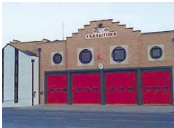
Distaccamento VVF Volontari di Volpiano (TO)

I comuni individuati per una sede di seconda scelta e quelli non presenti nel progetto potranno richiedere l'apertura di una sede volontaria accollandosi i costi aggiuntivi riguardanti gli automezzi e le attrezzature di cui al succitato punto I.