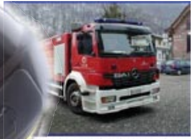
COOTTE - MERCEDES ATEGO 1828