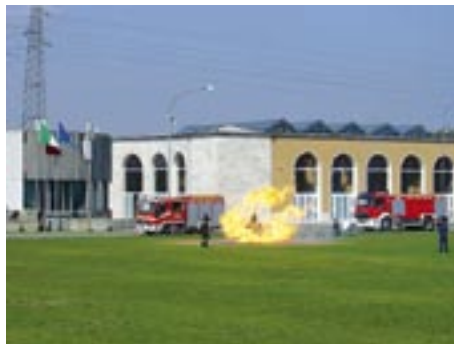
Addestramento all'estinzione di un incendio di bombola GPL