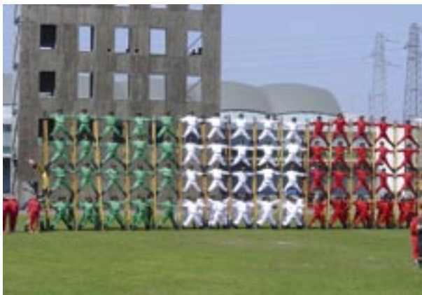
Esercizi Ginnici con le "scale italiane"

così pronto per effettuare il corso di formazione della durata di circa 120 ore presso il Comando provinciale di appartenenza con lezioni generalmente effettuate nei giorni festivi e prefestivi per venire incontro alle esigenze lavorative e di studio degli interessati. Terminato il corso e superato l'esame finale, finalmente si diventa vigili volontari con tutti gli obblighi e i doveri spettanti ad un vigile del fuoco.