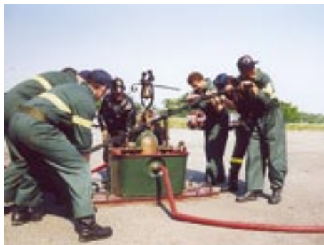
Un ritorno al passato con l'utilizzo di una pompa manuale

➤ della compatibilità con il servizio di volontariato di vigile del fuoco. Non possono essere accolte le domande di coloro che svolgono già la professione di vigile del fuoco permanente, di militare nelle forze armate o di polizia dello Stato oppure che siano amministratori o titolari di imprese che producono, installano, commercializzano impianti, dispositivi ed attrezzature antincendio e i titolari di aziende nel settore delle attività di formazione, vigilanza o consulenza in materia di antincendio.