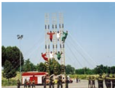
Esercizi Ginnici sulle "scale italiane" controventate