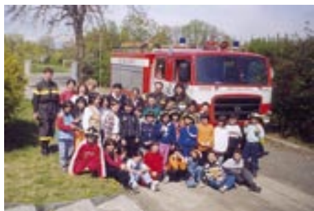
Foto di gruppo con bambini al termine di un corso di "Scuola Sicura"