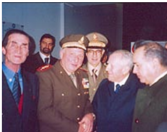
Il Presidente Nazionale Gino Gronchi incontra il Presidente della Repubblica Carlo Azeglio Ciampi e il Ministro dell'Interno Giuseppe Pisanu

Componente della Commissione per la categoria dei vigili del fuoco volontari istituita presso il Ministero dell'Interno con decreto 12 maggio 1984, n. 7398 e nominata membro del "Comitato di volontariato di Protezione Civile costituito presso la Presidenza del Consiglio dei Ministri, Dipartimento della Protezione Civile" con ordinanza n° 16776/FPC del 30/03/1989, l'Associazione Nazionale dei Vigili del Fuoco Volontari da qualche decennio collabora, in rappresentanza della componente volontaria, con il Dipartimento dei Vigili del Fuoco per tutte le problematiche e le esigenze inerenti il volontariato e l'integrazione di questo nell'ambito dei compiti istituzionali assegnati al Corpo.