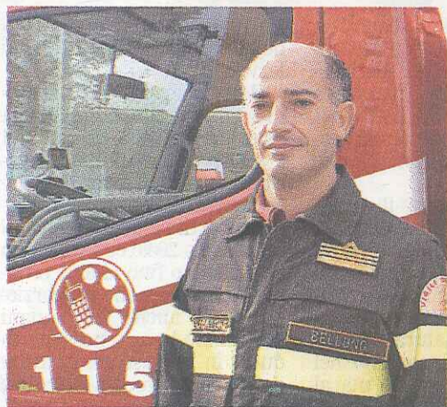
Il comandante provinciale Claudio Giacalone

LONGARONE. Più che un congresso sarà una vera e propria festa, una manifestazione agonistica tra i vari distaccamenti dei volontari sul territorio e un modo per sensibilizzare i piccoli.