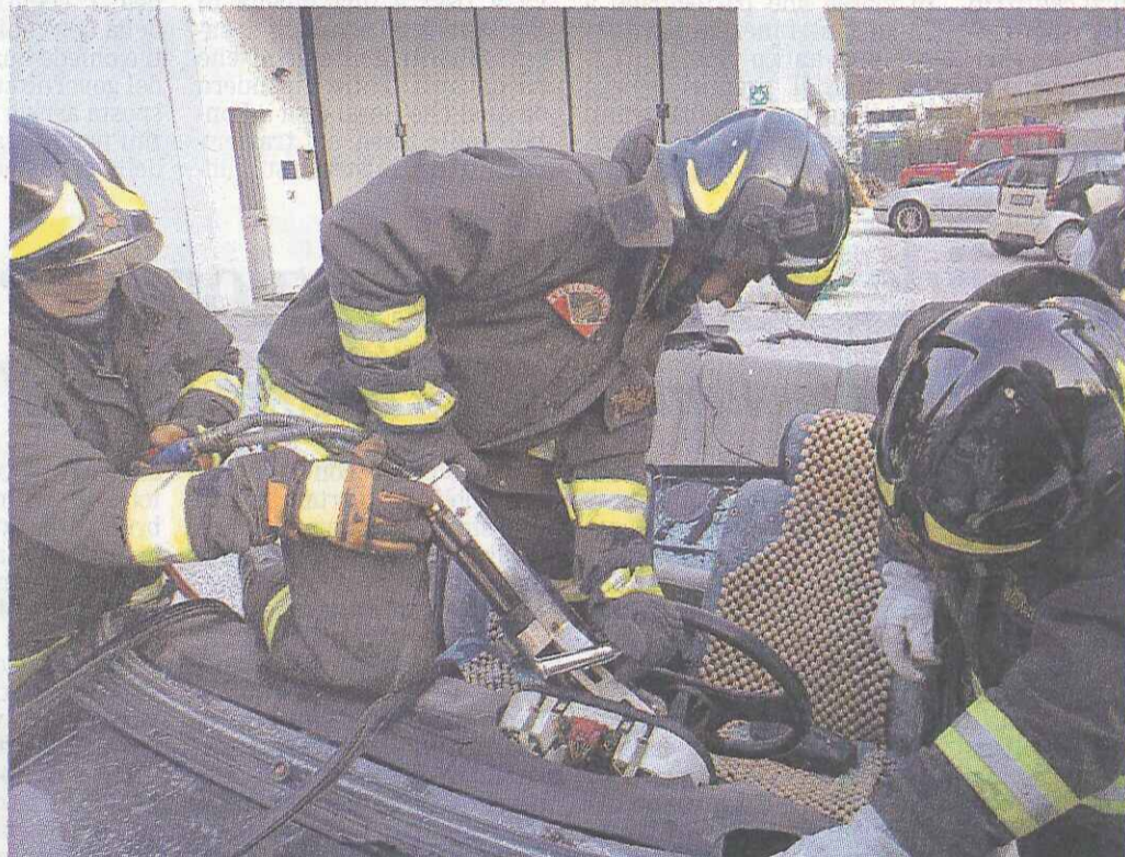
A fianco uno dei tanti interventi operati dai vigili del fuoco volontari di Longarone: il gruppo compie cento anni

E poi spazio ai bambini, con le Pompieropoli, gare di abilità con premi.