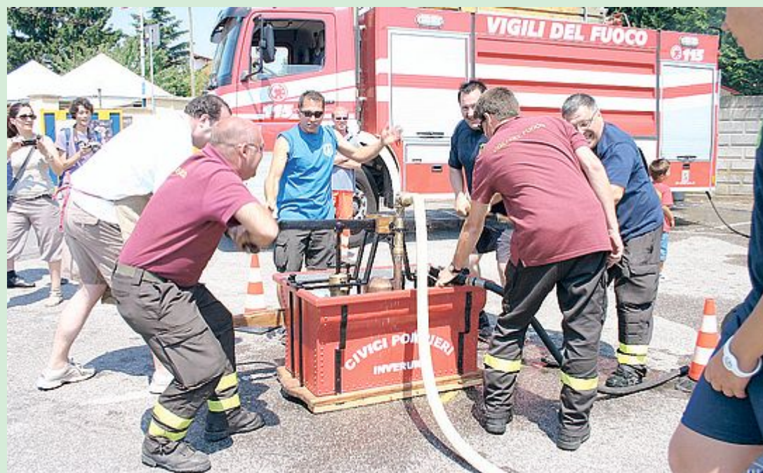
La storica pompa a mano dei civici pompieri d'Inveruno del 1857: custodita da un anziano per anni, all'insaputa degli stessi pompieri, è stata restaurata dai vigili volontari e domenica ha fatto la sua prima uscita ufficiale. È perfettamente funzionante, ma occorrono braccia allenate