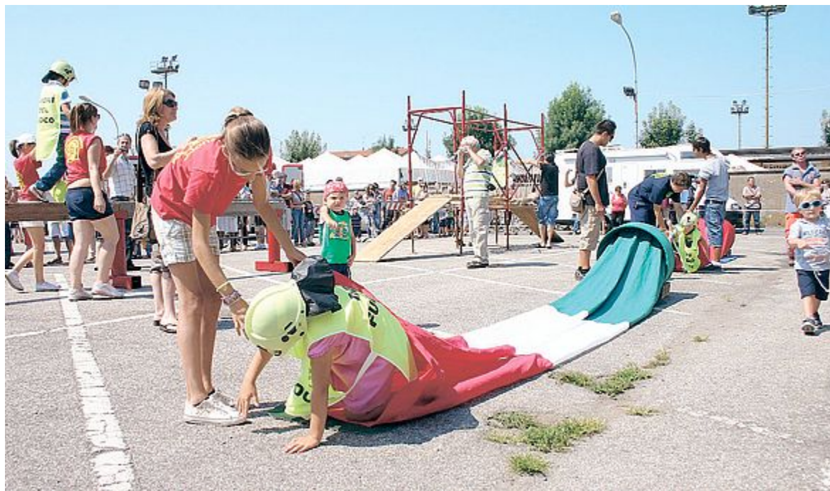
SFIDA Nelle varie prove a vegliare sui bambini perché non si facessero male c'erano i vigili del fuoco volontari

RECORD d'affluenza alla kermesse estiva organizzata dalla onlus "Amici dei Pompieri"; un'edizione del tutto speciale per via del 150° anniversario di fondazione del locale Corpo di Pompieri Volontari. Rock pesante e birre alla spina ma anche canzonette e flute di spumante per festeggiare (e sostenere) i vigili del fuoco volontari Inverunesi. Coi ricavi di quest'anno, tuttavia, non si acquisterà nessuna nuova attrezzatura ma si proseguirà con festeggiamenti in grande stile e si stamperà un libro a colori. Durante la "tre giorni" hanno riscosso particolare successo i "Live Queen" e i "Fuorirota", bistecche e fritti misti sono andati a ruba e s'è registrato il tutto esaurito. Momento clou lo spettacolo pirotecnico di sabato sera, durato oltre mezz'ora, che ha attirato numerosi abitanti dell'Altomilane-